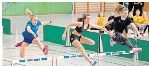
Hürdenläuferinnen wetteifern bei den Hallen-Kreismeisterschaften der Leichtathleten in der Sporthalle „Lange Trift“.

Mit 80 Teilnehmern wurden die Wettkämpfe der Kinderleichtathletik ausgetragen. Die Kinder gingen in den Disziplinen Weitsprung, Stoßen, Hindernissprint, 30-Meter-Sprint und Einbeinhüpfen an den Start. „Das Thema in diesem Jahr war Märchen, das heißt, die Mannschaften waren nach Märchen benannt wie zum Beispiel