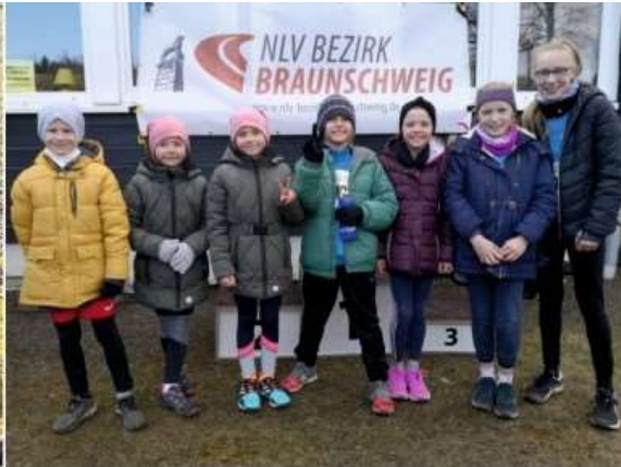
Nachwuchs TVG Gieboldehausen