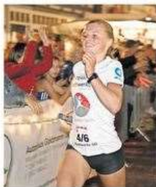
Wenn das Staffellenrennen zu Ende geht, ist es in der Innenstadt schon dunkel.